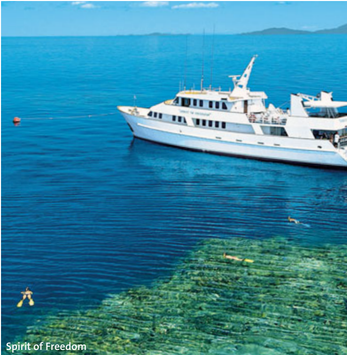
Spirit of Freedom

5 Tage/4 Nächte oder 4 Tage/3 Nächte ab/bis Cairns